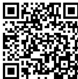
②入金のご連絡はこちら